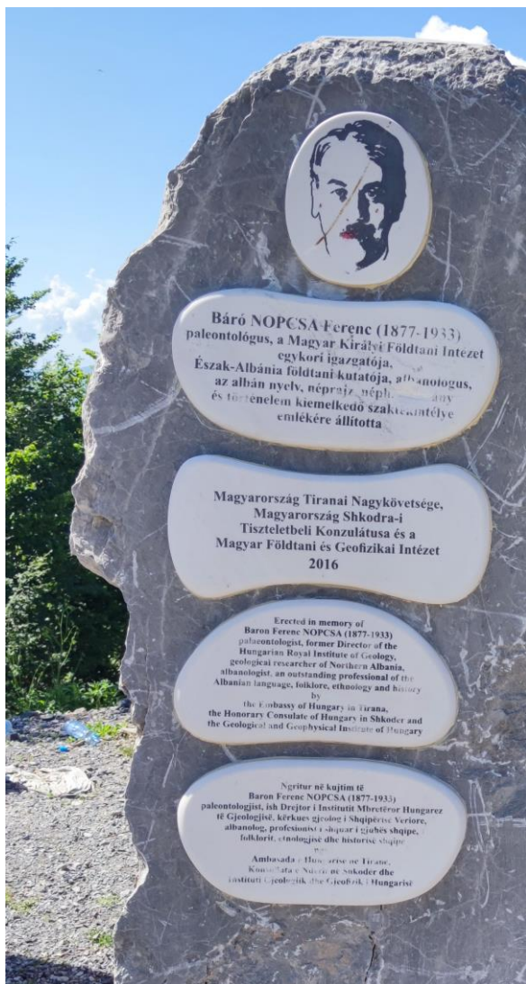
Nopcsa emléktáblája a Thetbe, az Albán Alpok szívébe vezető úton

hogy ez az idegbeteg, kalandokra hajlamos, hóbortos magyar főúr hogyan kerülhetett egy tudományos intézmény élére. Kétségtelen, hogy kiváló szakember volt, de sem hivatalosan működni, sem emberekkel bánni nem tudott. Azt képzelte, hogy a Földtani Intézet geológusaival, mint személyének alárendelt tisztviselőivel úgy bánhat, mint uradalma személyzetével. Nopcsa igazgatósága az intézet történetében a legsötétebb időszakot jelenti, s ennek hátrányát leginkább én szenvedtem meg.”